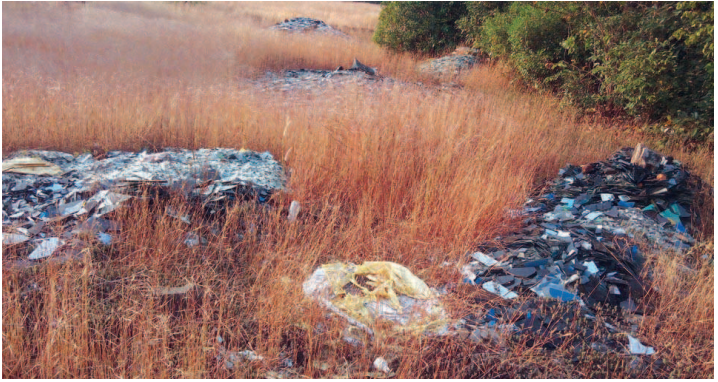
തിരിവിലെ പഞ്ചായത്ത് റോഡിന് സമീപമായി ഗ്ലാസ് മാലിന്യം തള്ളിയ നിലയിൽ.

നഗരസഭയുടെ മുൻപാലം വഖഫ് ഭൂമിയിൽ ഉൾപ്പെടുത്തിയതിന്റെ ഭാഗമായി 2004ൽ അഞ്ചുവർഷം എന്ന് നൽകിയിരുന്നു. ഇതിന്റെ ഭാഗമായി 2004ൽ അഞ്ചുവർഷം എന്ന് നൽകിയിരുന്നു.