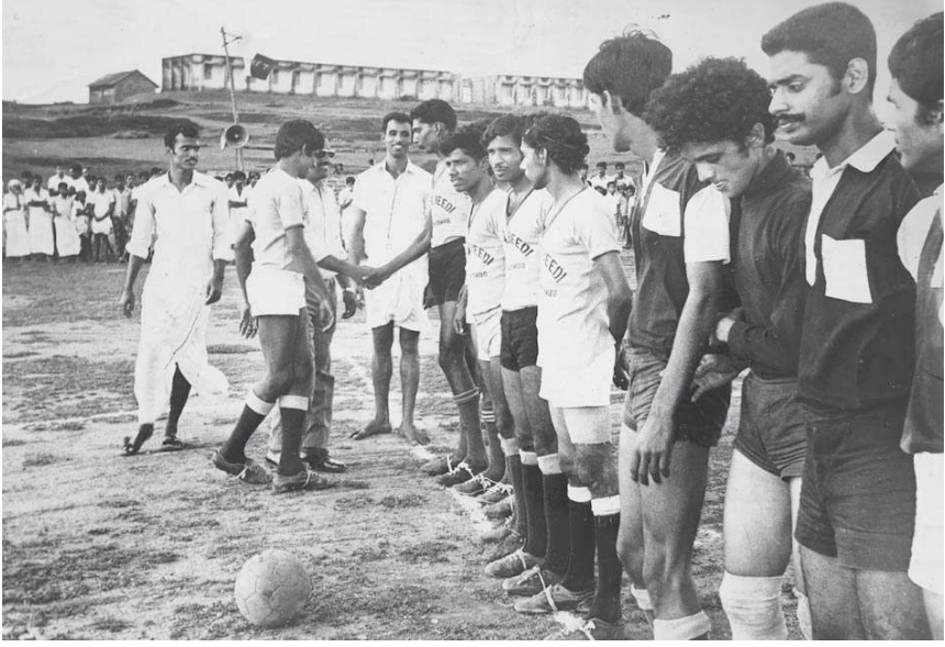
വർഷങ്ങൾക്ക് മുമ്പ് സെന്റ് നഗറിൽ നടന്ന ടൂർണ്ണമെന്റിൽ കളിക്കാറിനടങ്ങിയ വി.പി.എ.എം ടീം