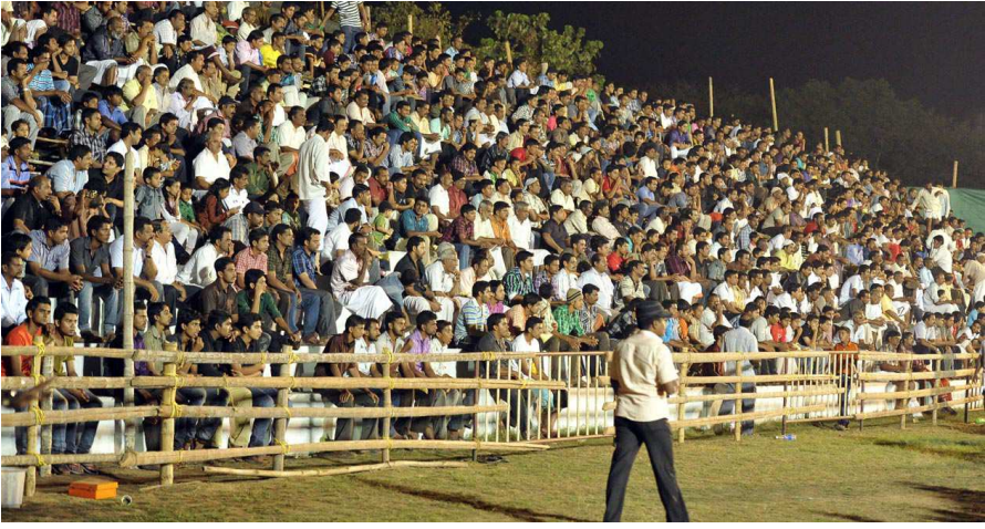
വളപട്ടണം സെവൻസ് ഫുട്ബോൾ ടൂർണ്ണമെന്റിന്റെ തിരഞ്ഞെടുത്ത ഗാലറി